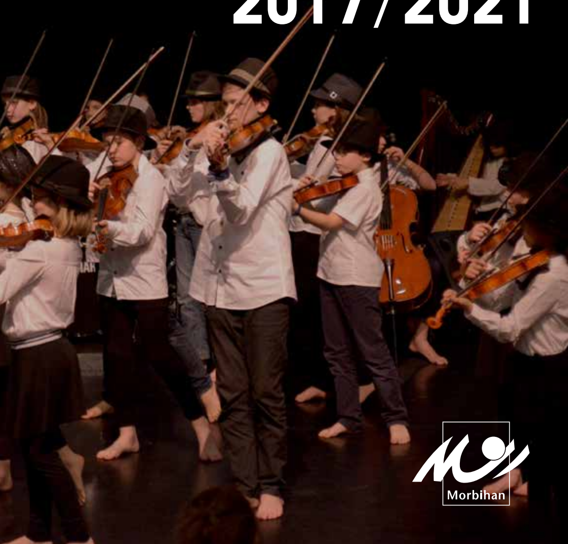
SCHÉMA DÉPARTEMENTAL DE DÉVELOPPEMENT DES ENSEIGNEMENTS ARTISTIQUES DU MORBIHAN 2017/2021