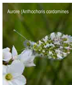
Aurore (Anthocharis cardamines)