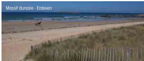
Massif dunaire - Erdeven