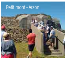
Petit mont - Arzon