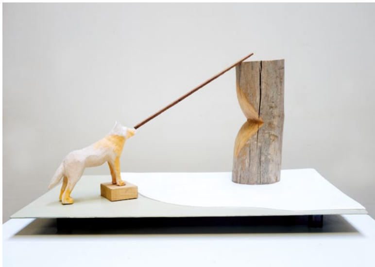
Roland Cognet, Princesse , 2018