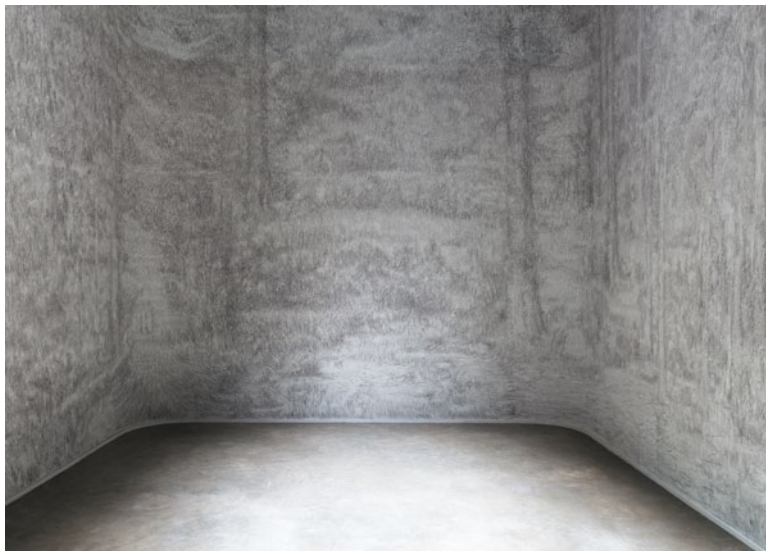
Marc Couturier, Dessin du troisième jour , 2014. Vue de l'exposition Inside , Palais de Tokyo Courtesy de l'artiste et Galerie Laurent Godin. Photo André Morin