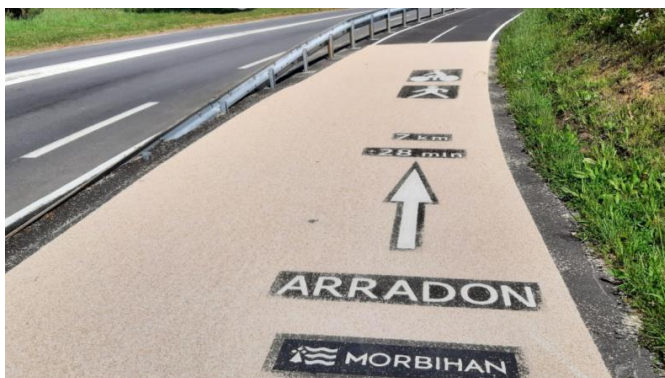
Exemple de marquage au sol

Le guidage des usagers a fait l'objet d'une attention particulière. Fidèle au parti pris retenu sur les sections précédentes, le Département a opté pour un marquage au sol sobre et immédiatement lisible avec la destination, la distance, et un temps de parcours calculé sur la base d'une vitesse moyenne de 15 km/h.